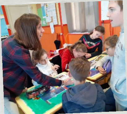
Analyse du gaspillage alimentaire du champ à l'assiette